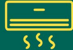
مخفي كاسيت - اسبليت