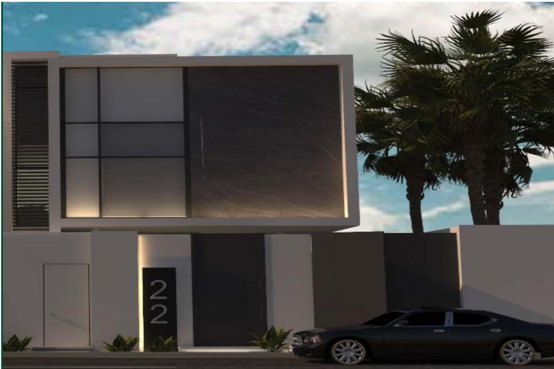
Tamdun Villas Sahafah