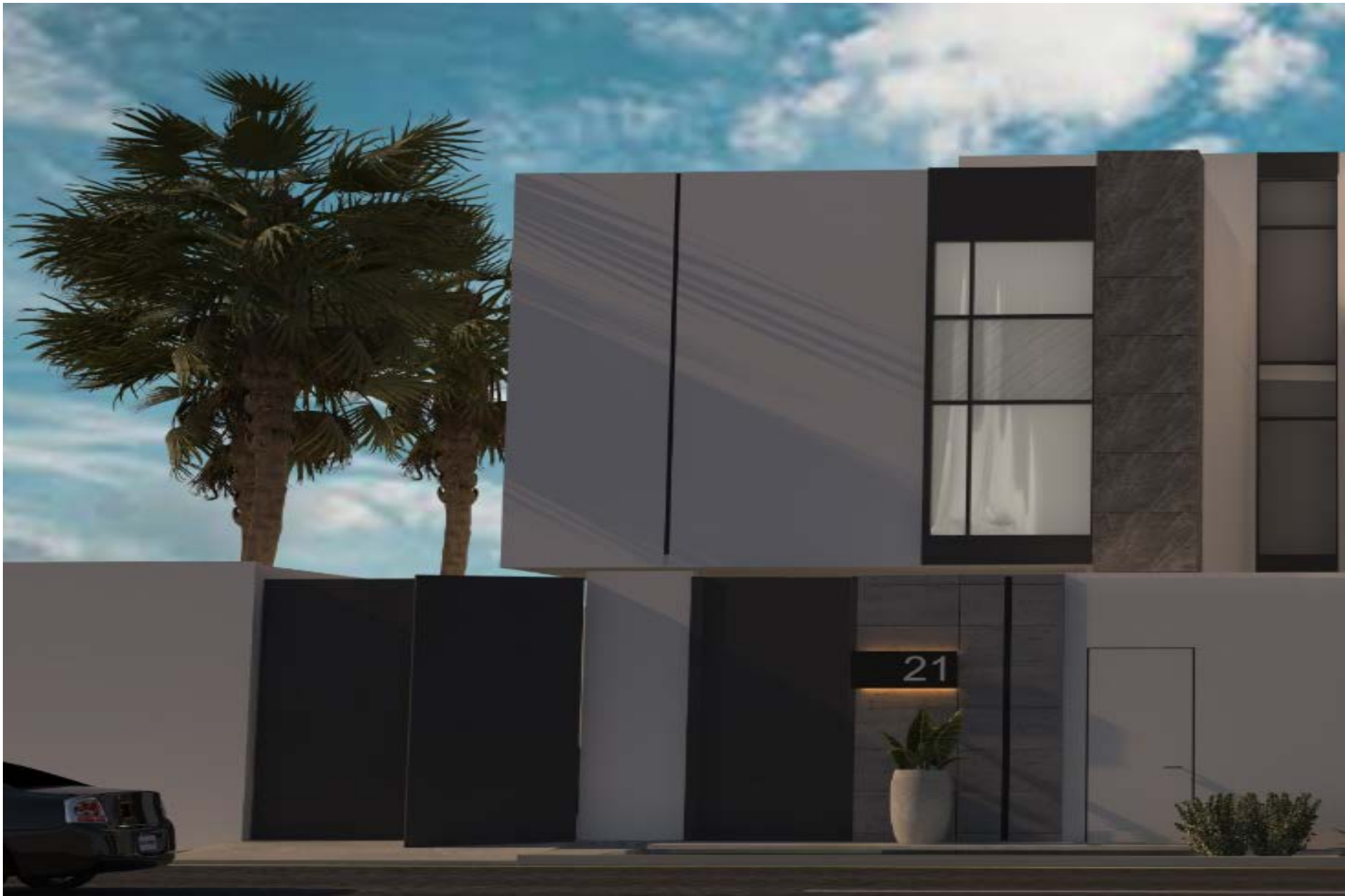
Tamdun Villas Sahafah